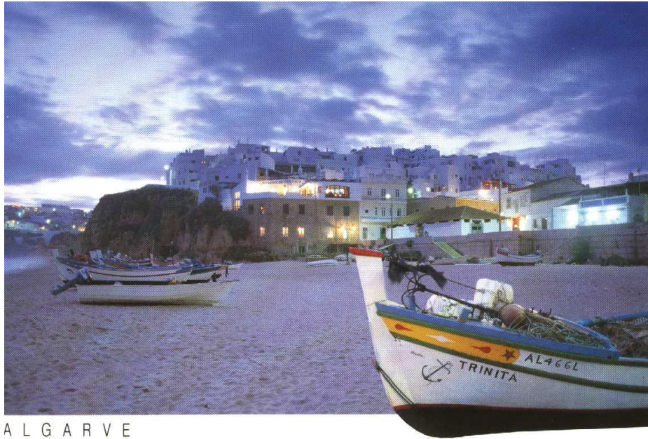
A L G A R V E